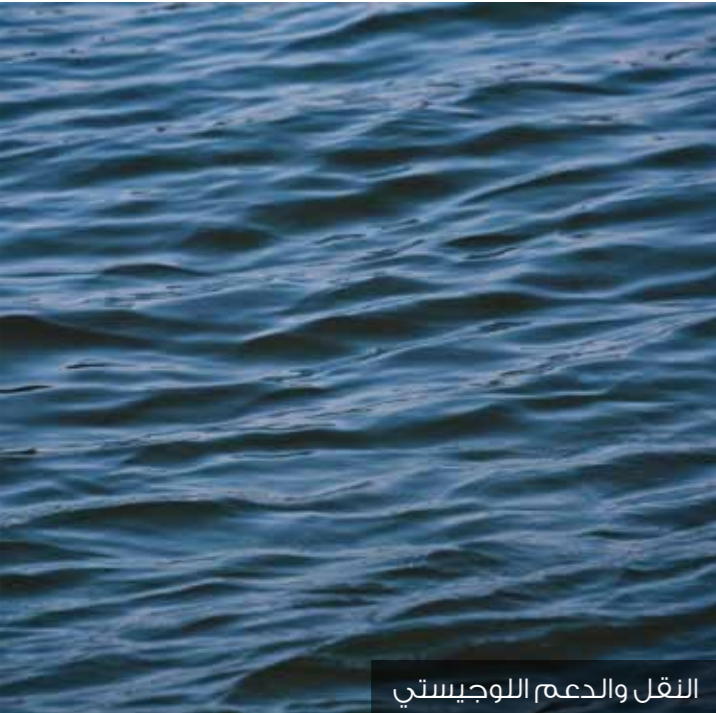
النقل والدعم اللوجيستي