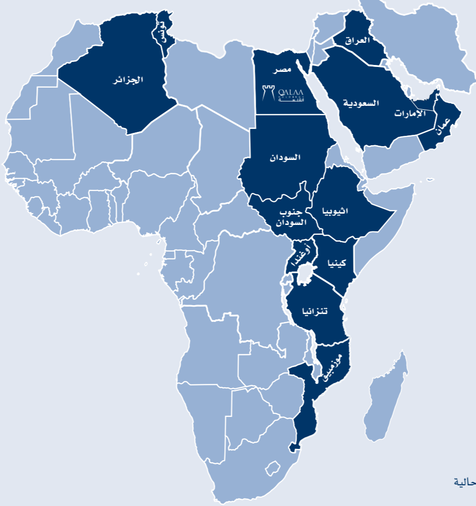
■ الاستثمارات الحالية